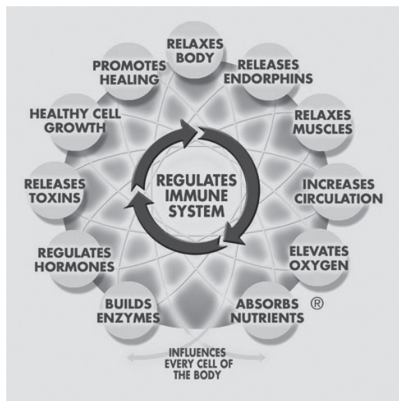
Figuur 3. De ontspanningsrespons (RR), die liggend in een floatcabine binnen enkele minuten wordt opgewekt.

bewegingssimulatie. Met behulp van instelbare bewegingssnelheden kan een golfbeweging worden opgewekt die het best te vergelijken is met gewichtloosheid in de ruimte en het gevoel geeft alsof je drijvend op water dobbert. Muziek of andere geluidstrillingen (zoals wedstrijdsimulaties) kunnen via ingebouwde luidsprekers en versterkers worden gevoeld en in combinatie met videoanalyse in mentale training worden gebruikt.