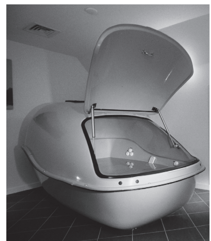
Figuur 1. Floatcabine.

Er bestaan twee soorten floatsystemen: een natte en een droge variant. Een nat